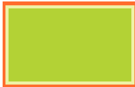
Página Doble (Spread)